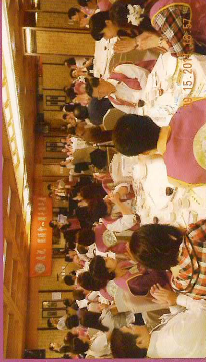
↑圓緣會週年慶盛況