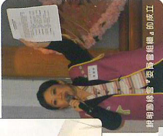
說明圓緣會「委員會組織」的成立