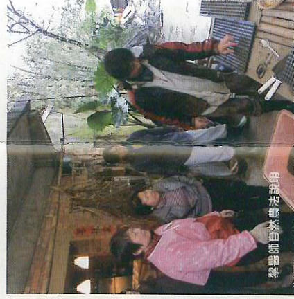
黎醫師自然農法談話