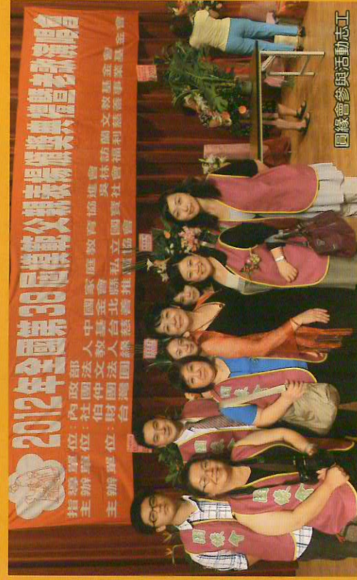
圓緣會參與活動志工